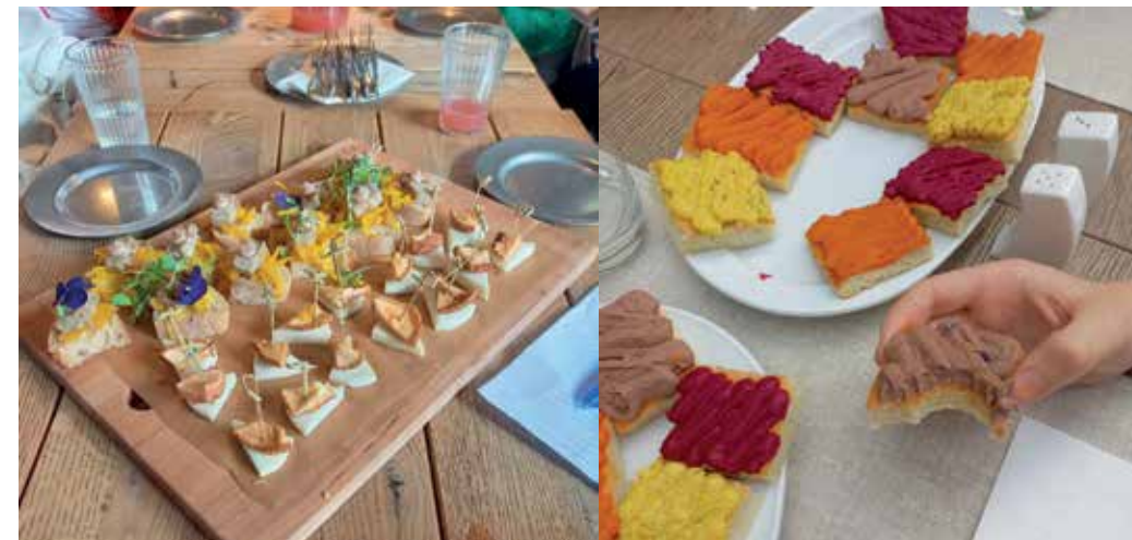
A projekt keretében a programban részt vevő középiskolások két, az alapítvány által „Fenntartható Vendéglátóhely”-ként elismert étterembe látogattak el a közelmúltban: a sashegyi Jardinette étterembe és a Gellért-hegy közelében lévő Czako kertbe

Újbuda Önkormányzata a környezettudatos, felelős étkezés elterjesztése érdekében új programot indított el a Felelős Gasztrohős Alapítvánnyal együttműködve. Két kerületi iskola, a Bethlen Gábor Általános Iskola és Gimnázium, illetve a Mechatronikai Technikum 60-60 diákja szerezhet gyakorlati tapasztalatokat a fenntartható étkezés terén.