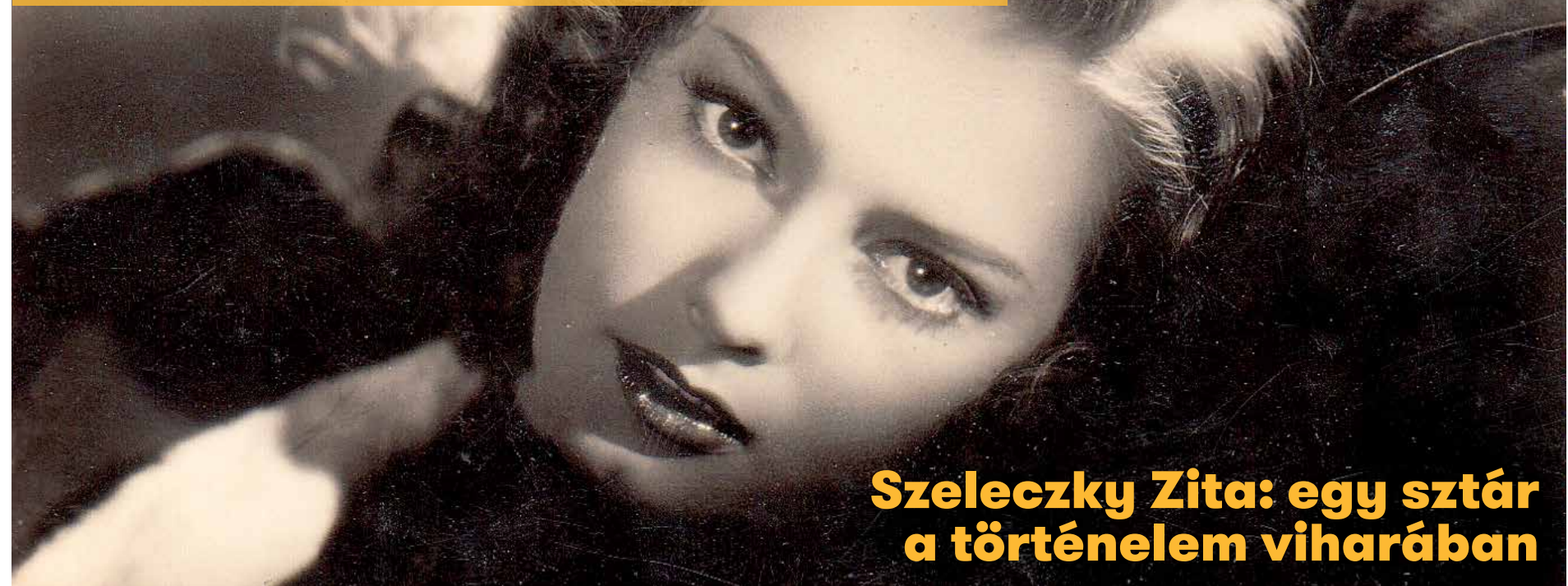
Szeleczy Zita: egy sztár a történelem viharában

Az újbudai születésű Szeleczy Zita a II. világháború előtti korszak ünneplott magyar színésznője volt. 1936 és 1944 között számtalan klasszikus színpadi szerepe mellett 26 filmben játszott, többségében fontos, ha éppen nem főszerepet. A kor egyik nőideáljává vált, ám a háború az ő sorsát is megváltoztatta.